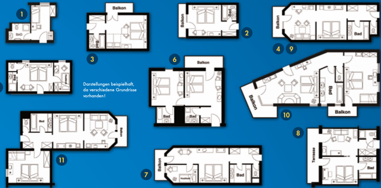
Darstellungen beispielhaft, da verschiedene Grundrisse vorhanden!